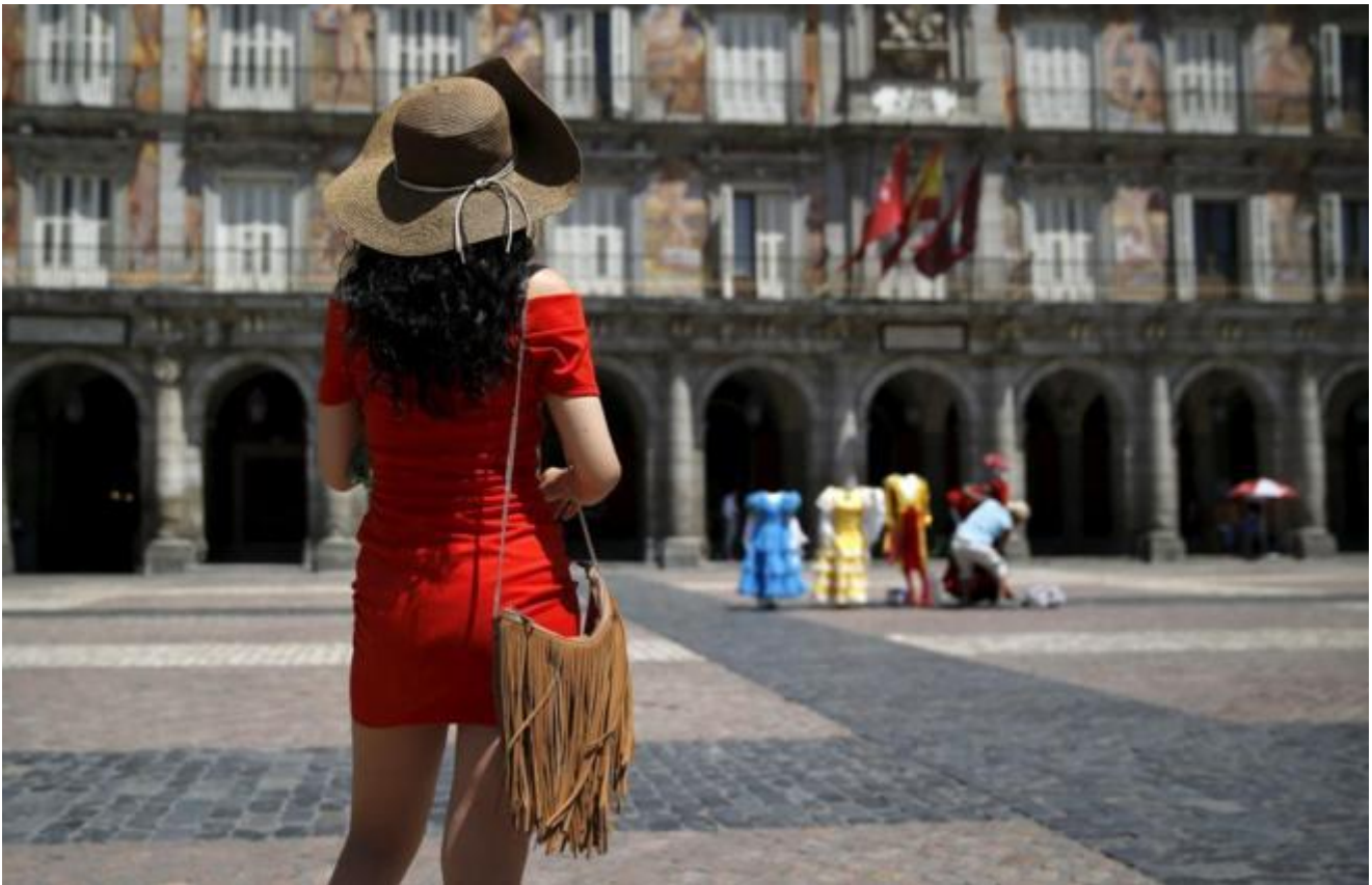
Una turista frente a la Casa de la Panadería de la Plaza Mayor de Madrid.