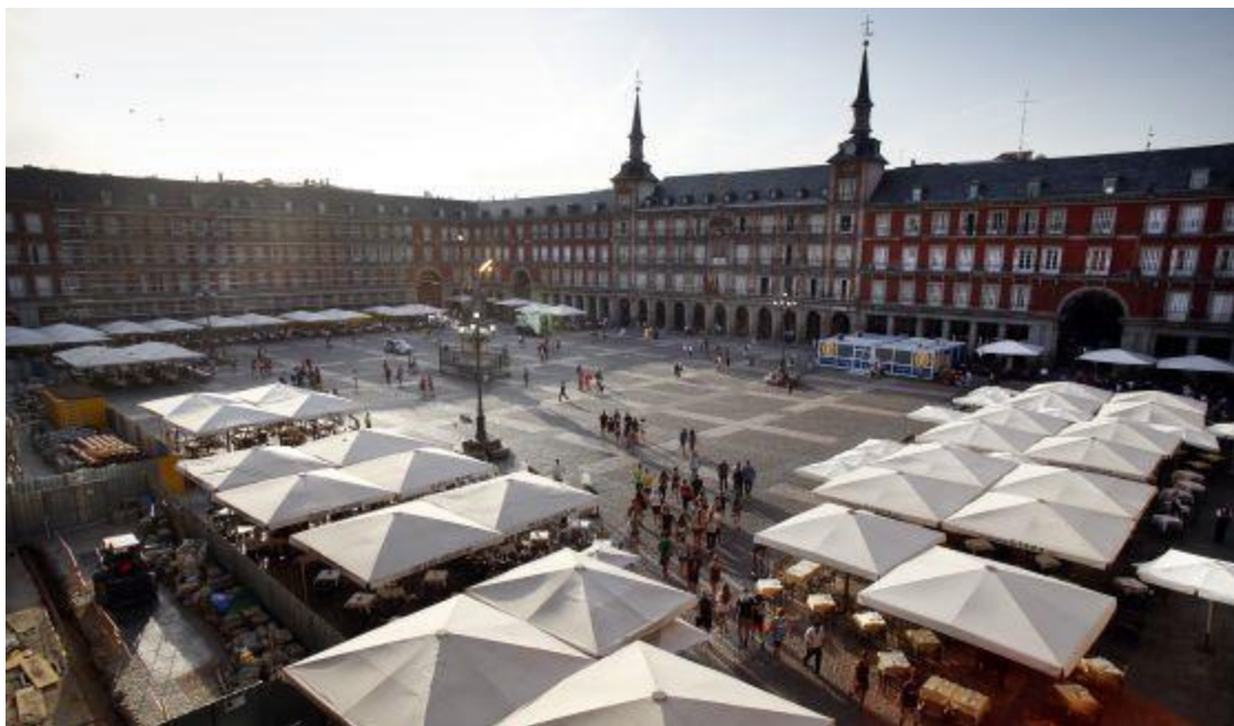
La plaza Mayor, fotografía ayer; en primer plano, a la izquierda, las obras en la Casa de la Carnicería.

El Ayuntamiento de Madrid y los empresarios de la Plaza Mayor preparan una reforma integral de este espacio urbano. En palabras del gobierno municipal, es necesario “repensar” la plaza. Ya está en marcha una primera fase para remozar las fachadas , pero de aquí a 2017, para su cuarto centenario, el gobierno local de Manuela Carmena quiere replantear los usos de la plaza, reduciendo mercadillos y actos comerciales en favor de iniciativas culturales. Los empresarios han presentado esta semana a Carmena un proyecto que prevé ilustrar los soportales y resucitarlos con hostelería, exposiciones y performances ; unificar el mobiliario; y poner en marcha una agenda de actos durante todo el año con un eje temático diferente cada mes.